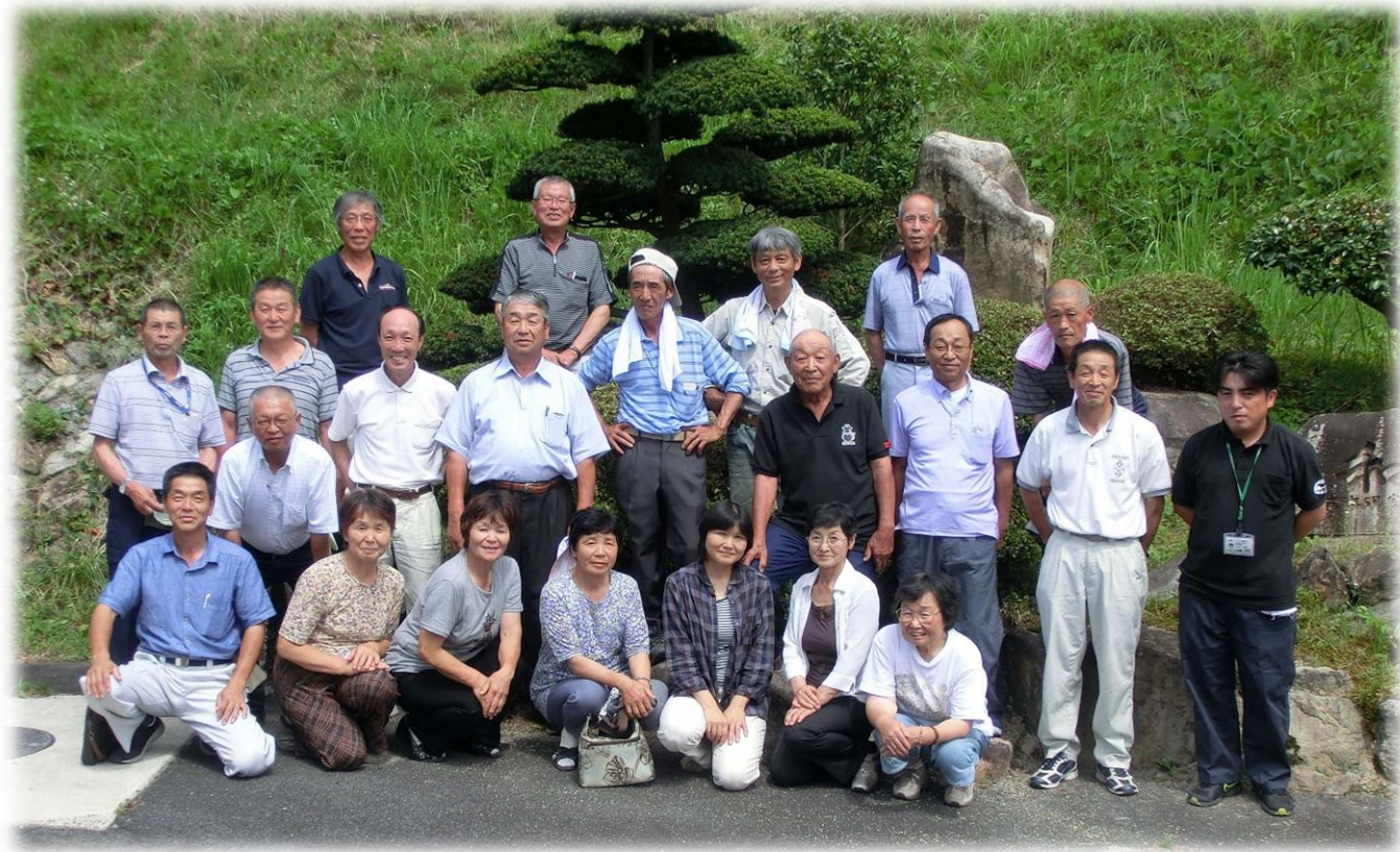
ゆのつ 温泉津町和牛改良組合のみなさん