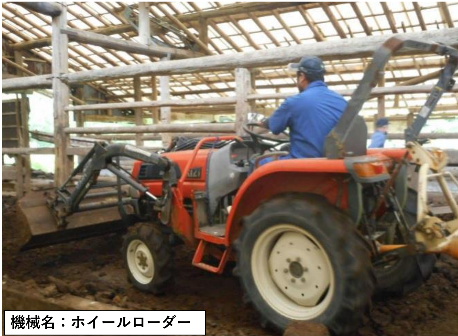
機械名：ホイールローダー