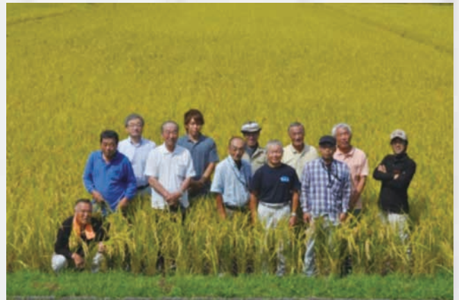
島の香り隠岐藻塩米生産者の皆さん