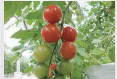
六日市のミニトマト