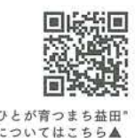
ひとが育つまち益田についてはこちら▲