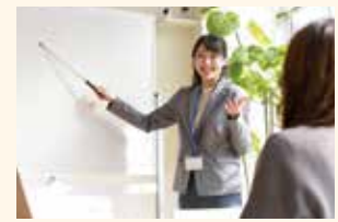
※写真・イラストはイメージです。

対面形式 島根大学生物資源科学部附属本庄総合農場及び三瓶演習林で、専門的な実習を行います。