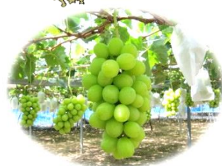
「シャインマスカット」